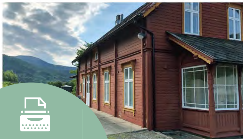
Kommunens ja til å rive Gudd stasjon.

kan rives. Fortidsminneforeningen og en, men nå har Fylkesmannen stadfestet kommunens