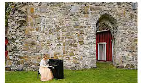
Reinsklosterets ruiner.