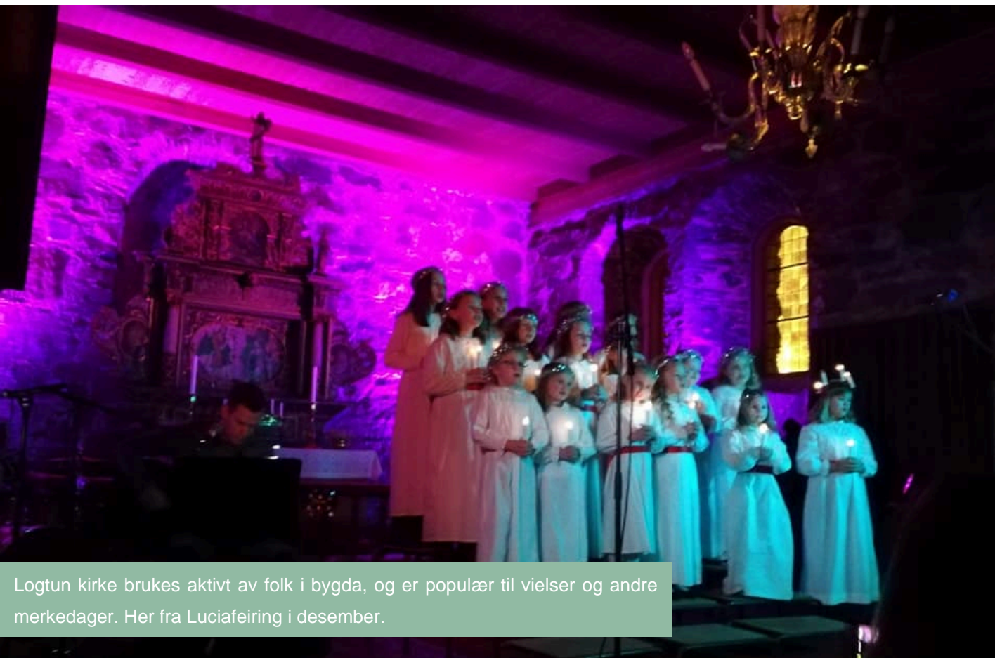
Logtun kirke brukes aktivt av folk i bygda, og er populær til vielser og andre merkedager. Her fra Luciafeiring i desember.