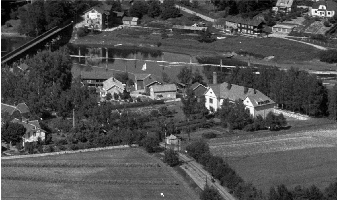
Eikli skole, flyfoto 1940-tallet

Vi vil igjen oppfordre Ringerike kommune til å ta forvalterrollen på alvor, og være et forbilde når det gjelder å bevare bygninger og bygningsmiljøer med verneverdi. Kulturminnene er en ressurs for samfunnet, noe vi har sett mange gode eksempler på i byene i Viken de siste årene.