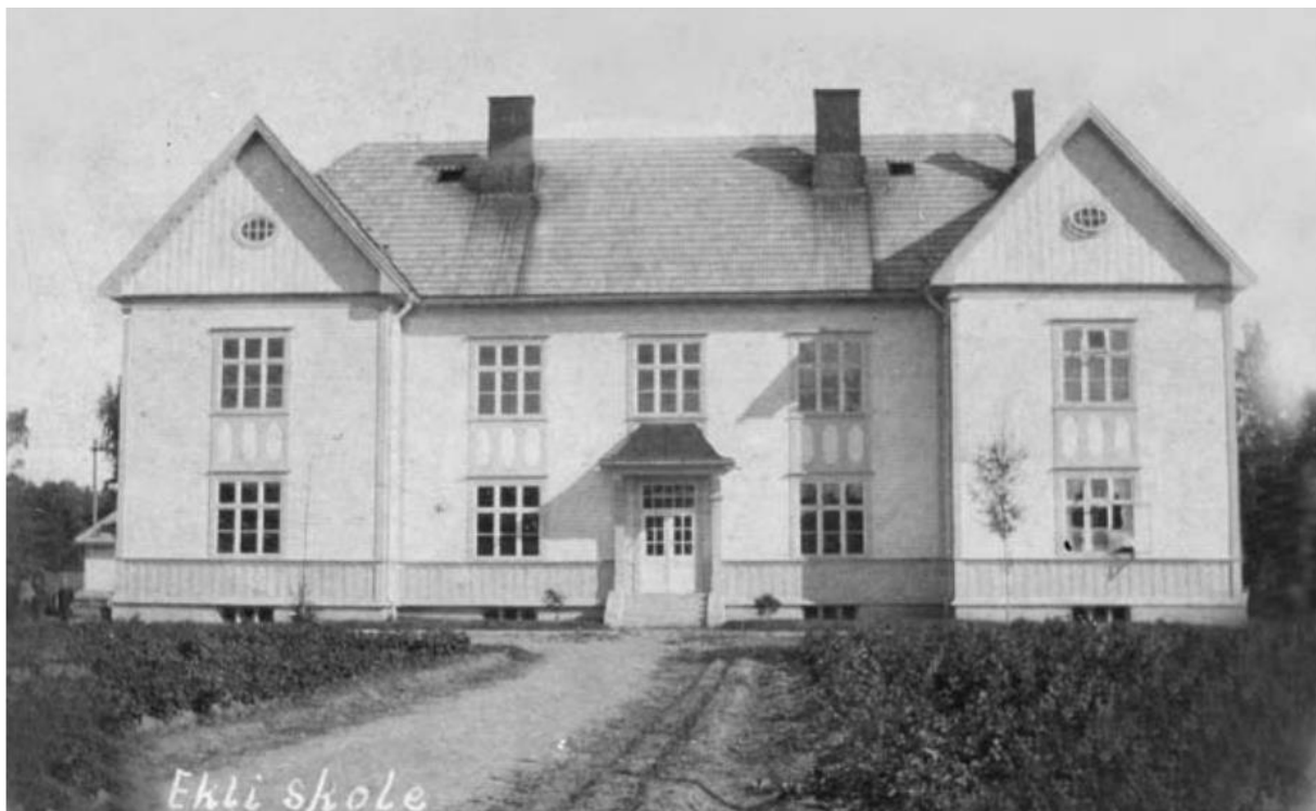
Eikli skole 1916 (postkort)

Gjeldende reguleringsplan er områdeplan for Hønefoss sentrum (2019). Eikli skole ligger innenfor felt B/T3 og B/T1 (arealformål byggeområde bolig/tjenesteyting).