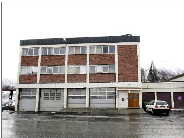
UTRANGERT: Gamle Tromsdalen brannstasjon.

Tromsø kommune har et godt og variert tilbud for sine innbyggere innenfor de fleste fritidsaktiviteter. Vi har mange ulike arenaer for både kultur, kunst og kreativitet. Vi har utallige idrettsbaner, løyper og haller. For både friluftslivet og det andre utelivet er Tromsø allerede verdenskjent og beryktet. Vi har tilrettelagt for det meste som tromsøborgerne kunne tenkt seg å drive med på fritida, men vi mangler noe viktig! For fiskerne, hobby-reparatørene, bytteentusiastene og pellenmakerne trenger et tilholdssted. Det kan gamle Tromsdalen brannstasjon bli, hvis ikke kommunen river bygget først – velkommen til ideen om Tromsø Folkeverksted.